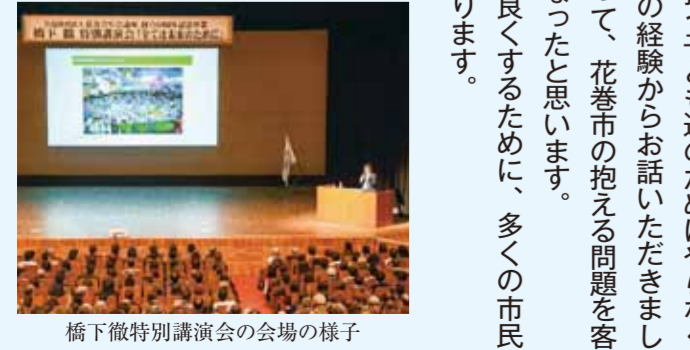
橋下徹特別講演会の会場の様子