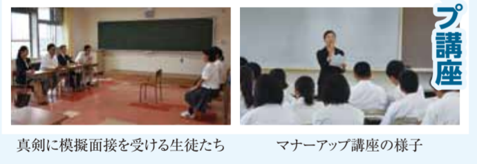
真剣に模擬面接を受ける生徒たち マナーアップ講座の様子

九月十二日(火)に花巻農業高等学校の学生を対象とした模擬就職面接会とマナーアップ講座を行いました。 我々が面接官を担当し、学生達にとって普段慣れている先生方との面接とは違った緊張の中、各面接官からの指摘やアドバイス等が本番に向けての良い刺激となったのではと思います。また、マナーアップ講座は学生達が面接で大切にしたいポイントや緊張を和らげる方法を学ぶ機会となりました。 我々は、次代を担う学生達が、より生き生きと自らの人生を歩んでいくために、様々な青少年育成事業に取り組んで参ります。