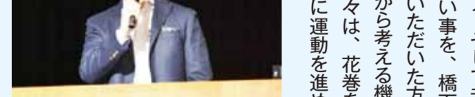
【全ては未来のために】をテーマに講演された橋下徹氏